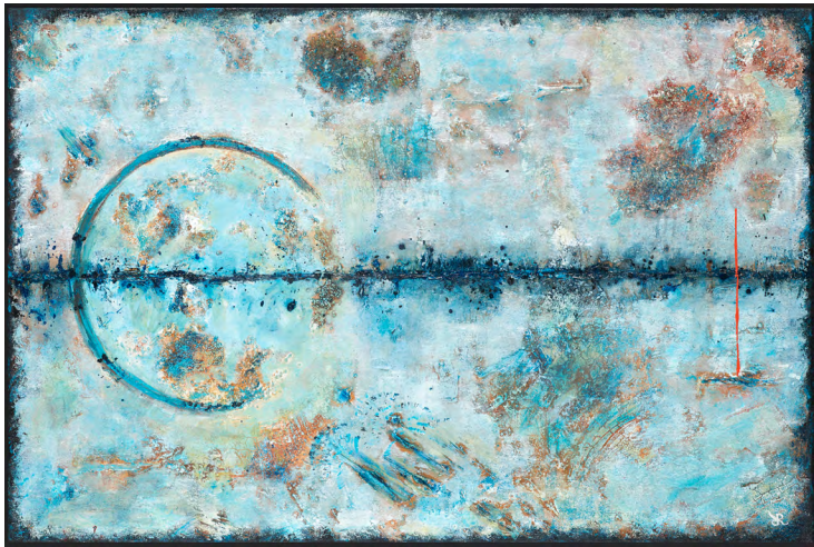
Symphony of Shades nr 2 © Rina Rox