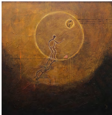
Genesis © Rina Rox