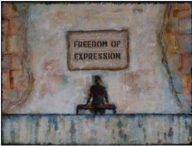
Freedom of Expression