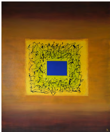
Enigma 4 © Rina Rox