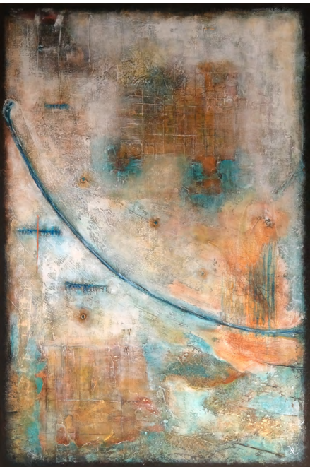
February 24th

(Uit de Inleiding bij de tentoonstellingsbrochure door Johan Swinnen )