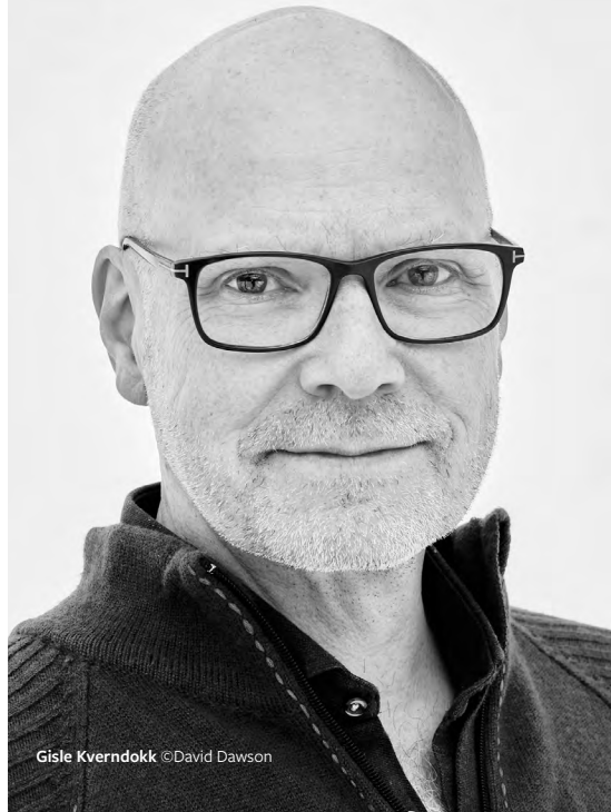
Gisle Kverndokk ©David Dawson

The Silk Road is muziek die het publiek niet alleen beluistert, maar beleeft — een uitnodiging om grenzen te overstijgen en je te laten meevoeren door een verhaal dat al duizenden jaren mensen inspireert.